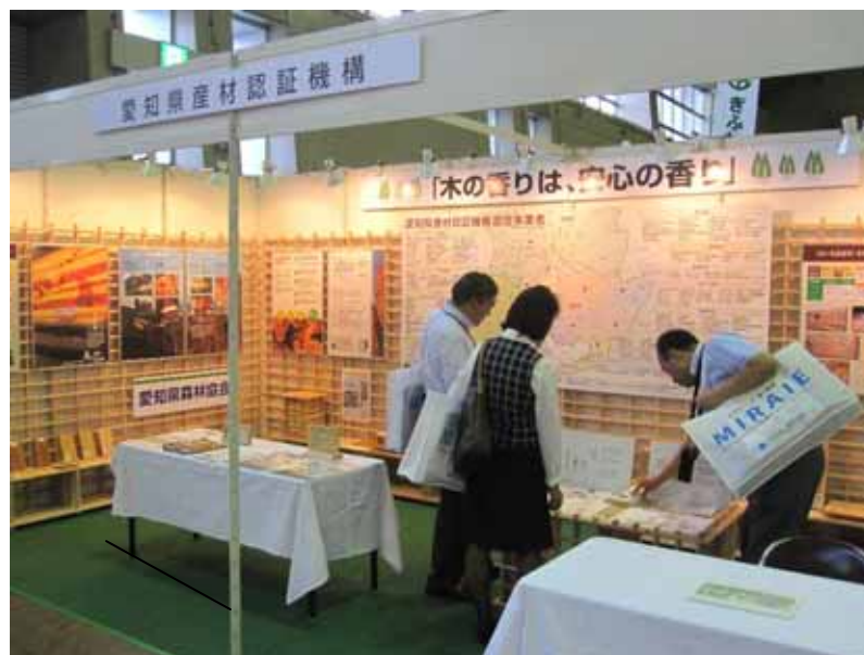
建築総合展での「あいち認証材」展示