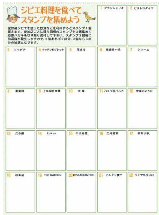
ジビエ・グルメ・スタンプラリー