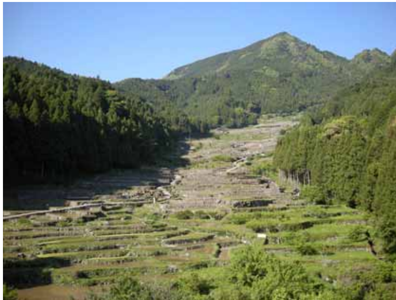
小水力発電の導入 (新城市四谷千枚田)

中山間地域の活性化を目的に、新城市四谷地区において、再生可能エネルギーの利用拡大を図るため、農業用水を利用した小水力発電を導入