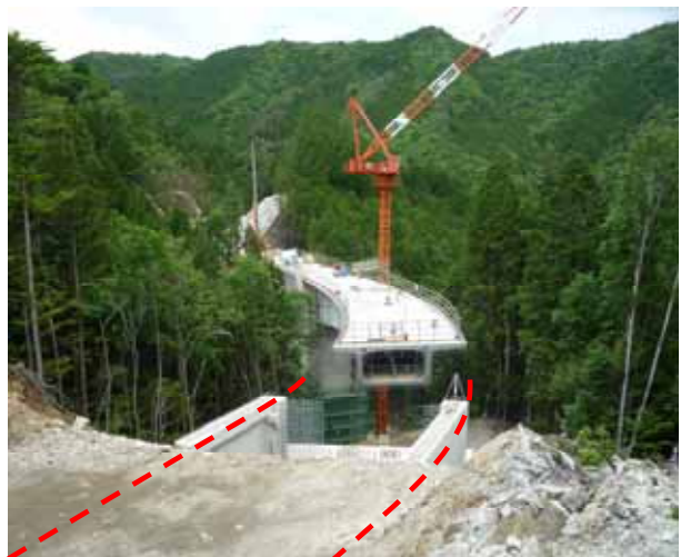
広域農道奥三河地区 (橋梁工事の実施状況)