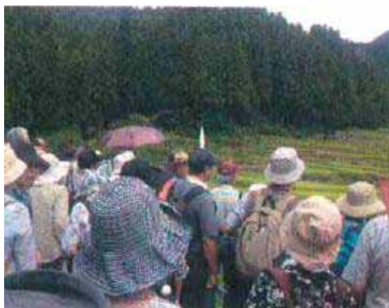
四谷千枚田の見学

地域ならではの自然の「素材」を活用し、生物多様性への意識を高め、地域からの生物多様性保全に対する関心を引き起こし、自発的な行動のきっかけとする生物多様性セミナーを開催