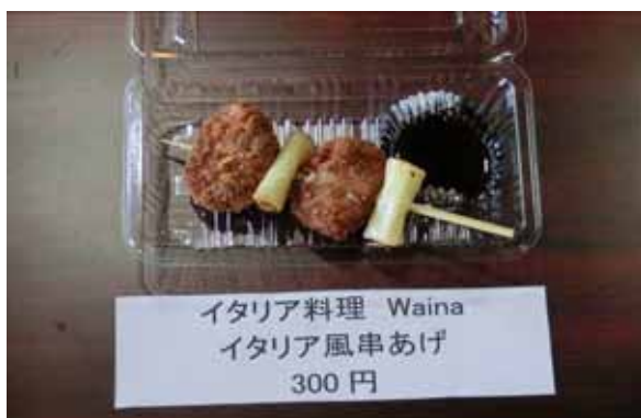
グランプリ 『イタリア風串あげ』