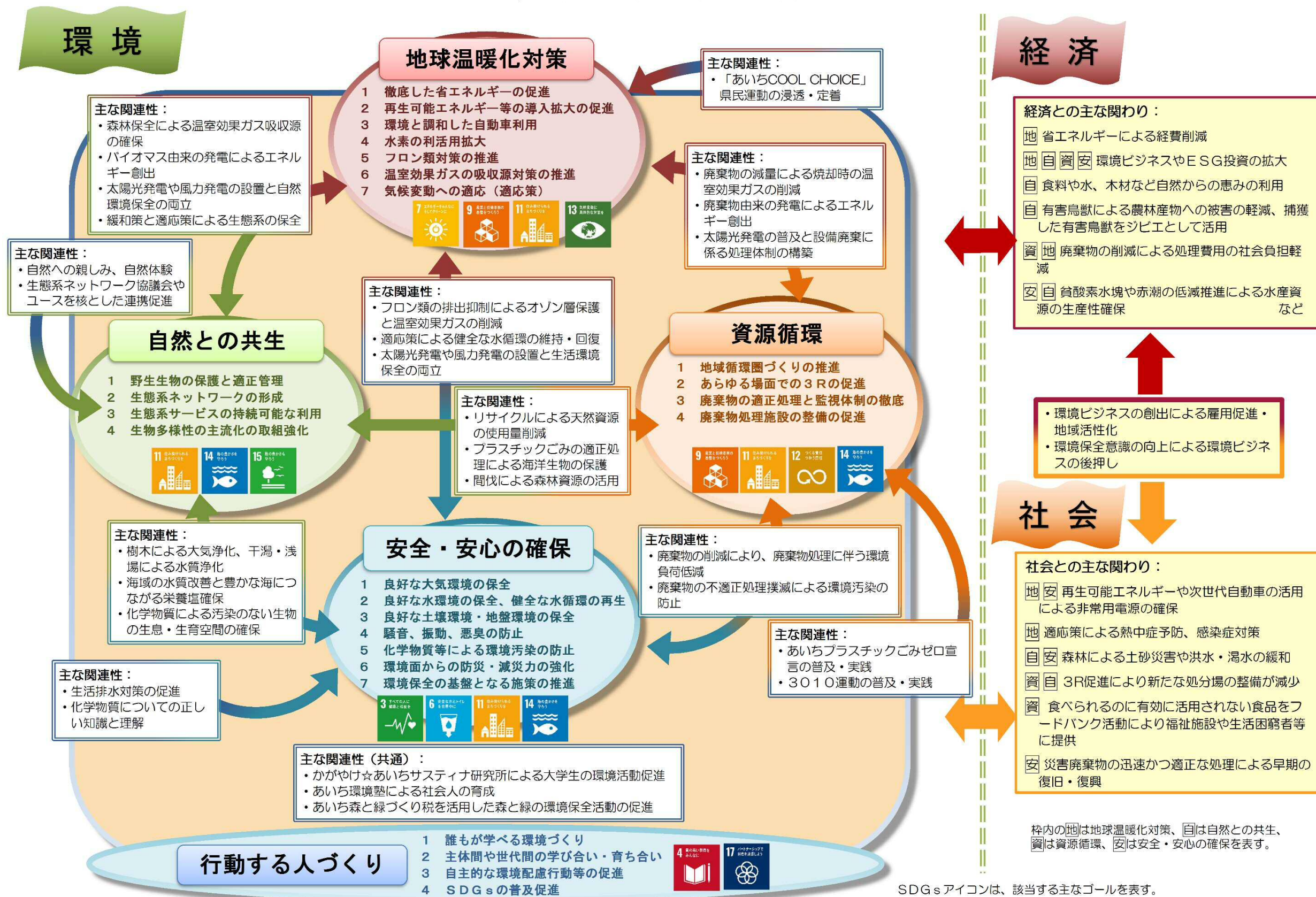
各取組分野の関連性と経済・社会との関わりイメージ