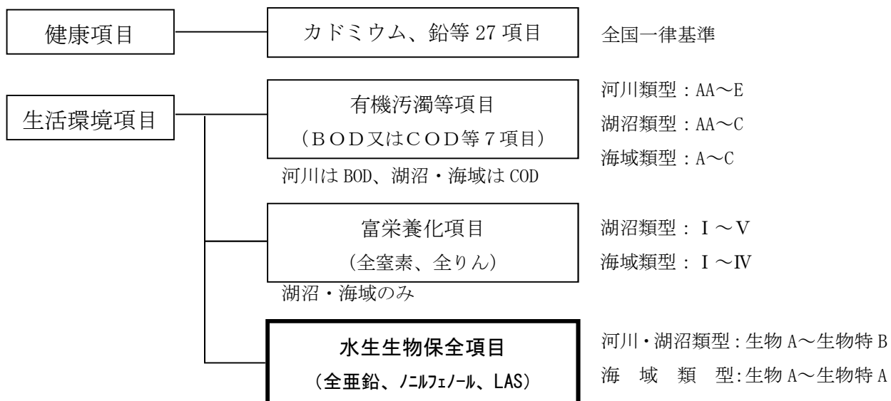
図 1 水質汚濁に係る環境基準（※）の項目と類型について

（※）水質汚濁について人の健康を保護し、生活環境を保全する上で維持することが望ましい基準（以下「水質環境基準」という。）として、環境基本法（平成 5 年法律第 91 号）第 16 条第 1 項に定められている。水質環境基準には人の健康の保護に関する基準（以下「健康項目」という。）と生活環境の保全に関する基準（以下「生活環境項目」という。）の 2 つがある。健康項目は全水域に一律の基準が適用され、生活環境項目は、国又は県が水域の利用目的や水生生物の生息状況の適応性に応じて、主な水域群別に類型指定を行い、水域ごとに定められた基準が適用される。