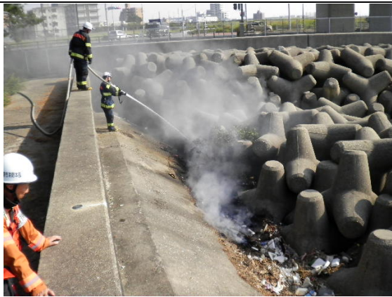
写真3 海岸漂着物の火災