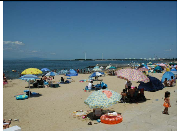
写真1 大野海水浴場