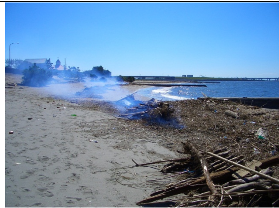
写真4 海岸漂着物の野焼き