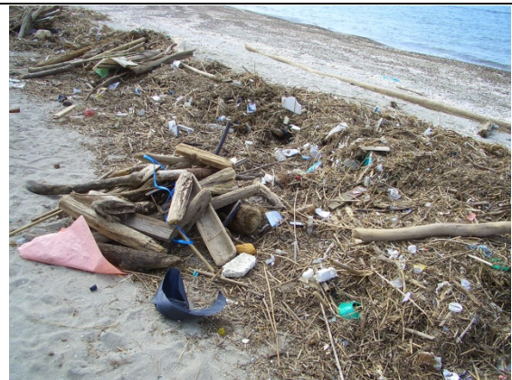
写真6 堆積した海岸漂着物②