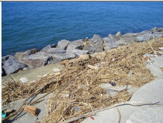
写真5 堆積した海岸漂着物①