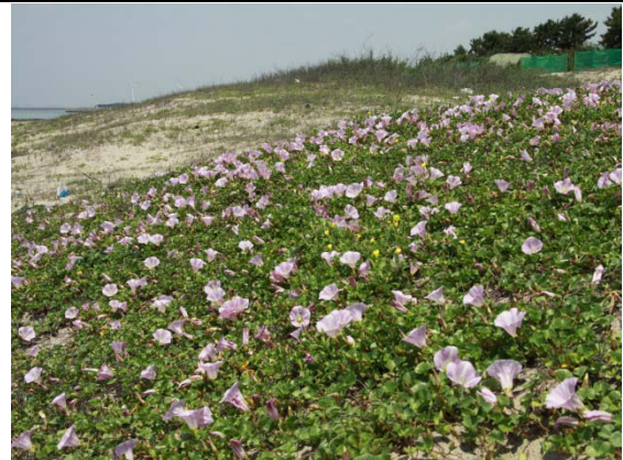
写真2 ハマヒルガオの群生