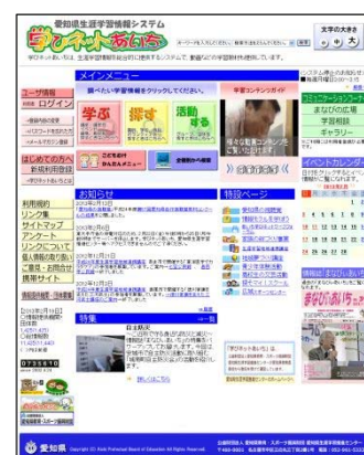
【学びネットあいち】

とりわけ、生涯学習情報提供システム「学びネットあいち」を、学習コンテンツの充実などにより、利便性の高いシステムへ改修するとともに、大学等高等教育機関と連携し、現代的な課題に対応できる市町村生涯学習担当職員の養成を行う。また、本県の生涯学習推進のための中核的施設である愛知県生涯学習推進センターについては、県の重点改革プログラムに基づき、平成24年度から生涯学習施策をより広域的・専門的に推進する体制に見直したところであり、その機能の充実を図っていく。