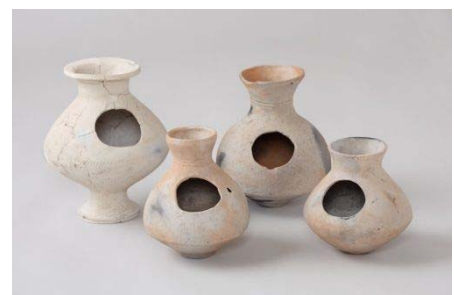
【朝日遺跡の出土遺物】

国の重要文化財指定を目指していた朝日遺跡の出土遺物については、平成 24 年 9 月に 2,028 点が国の重要文化財に指定された。これに伴い、重要文化財記念展「朝日遺跡、よみがえる弥生の技」を平成 25 年 3 月 20 日から平成 25 年 5 月 19 日まで開催し、広く県民に地域の歴史や文化に親しむ機会を提供した。