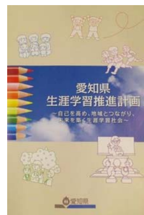
【生涯学習推進計画】