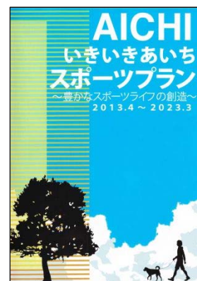
【スポーツ推進計画】

スポーツを通して県民の夢と希望を育み、地域を盛り上げることができるようなスポーツイベントの推進体制を整え、国際競技大会等の招致・開催を積極的に推進することで、国際的な交流機会の拡充を目指す。