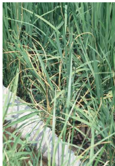
図2 イネ縞葉枯病 (ゆうれい症状)

抵抗性品種の作付けが少なく、ヒメトビウンカを対象に育苗箱施薬を実施していない地域や不耕起V溝直播栽培で、殺虫剤の種子塗抹を実施していない地域では、表を参考に、水田に侵入する成虫と次の世代の幼虫を対象に幼穂形成期までに本田防除を実施しましょう。