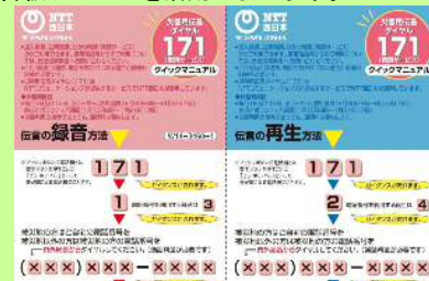
災害用伝言ダイヤル (171) クリックマニュアル

大勢が一斉に電話しようとなると、回線が混み合っつながりにくくなる場合がありますので、安否確認には災害用伝言ダイヤルや災害用伝言板サービスを活用しましょう。