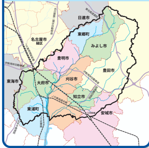
■ 境川・逢妻川・猿渡川の流域位置図 (流域面積:約266km 2 )