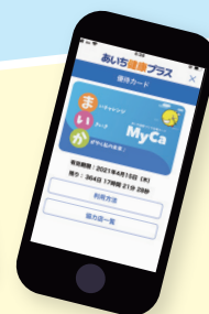
※アプリ版[MyCa]イメージ