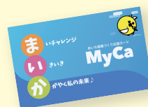
※あいち健康づくり応援カード～MyCa～イメージ