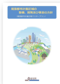
尾張都市計画区域の整備、開発及び保全の方針 (尾張都市計画区域マスタープラン)

今回、(仮称)名岐道路(一宮～一宮木曾川)を、円滑な都市活動を確保し良好な都市環境を保持するために必要な都市施設として都市計画に定めようとするものです。