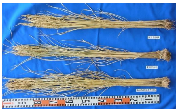
図3 稈長の比較(上から「あさひの夢」、 「愛知135号」、 「あいちのかおりSBL」)