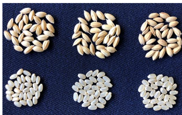
図4 粳と玄米の比較(左から「あさひの夢」、 「愛知135号」、 「あいちのかおりSBL」)