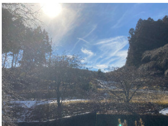
④地点から西方向を撮影※