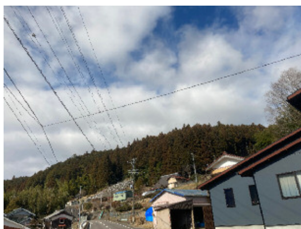
⑤地点から北方向を撮影※

※ 写真で確認できる尾根は事業実施想定区域内の尾根ではありません。 事業実施想定区域内の尾根はさらに奥となります。