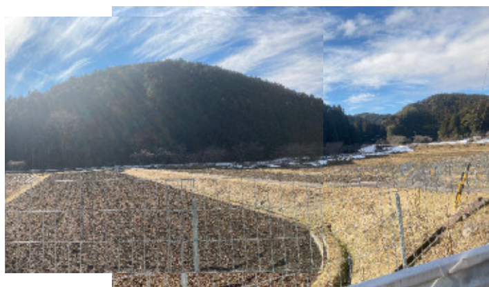
⑤地点から西方向を撮影※