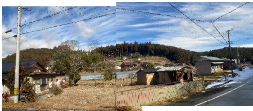
④地点から東方向を撮影※