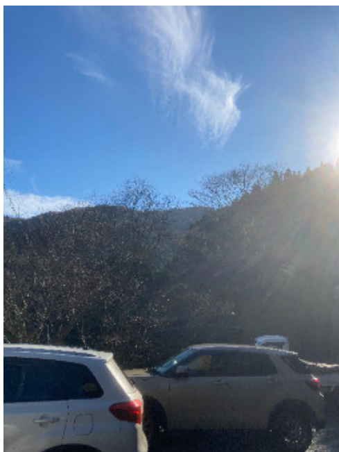
⑧地点から南方向を撮影※

※ 写真で確認できる尾根は事業実施想定区域内の尾根ではありません。 事業実施想定区域内の尾根はさらに奥となります。