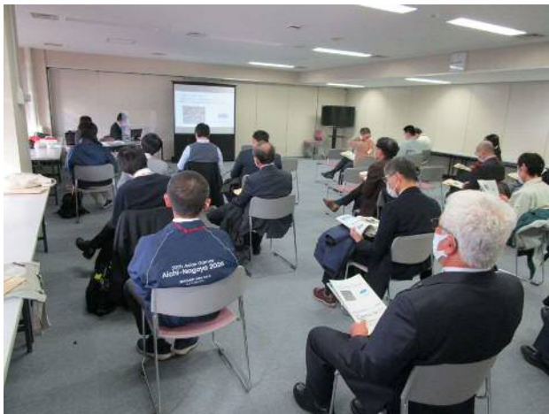
（座学セミナーの状況）