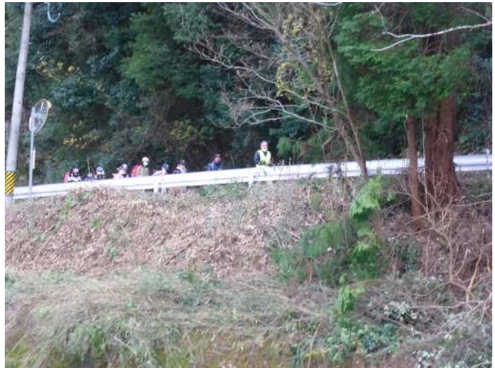
写真3 小学校児童と 一緒に登校す る自治区区民