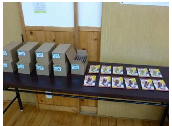
写真4 ホイッスル付ライト 120個購入