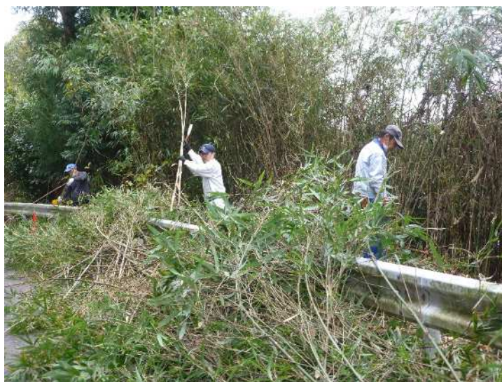
写真 9 作業後