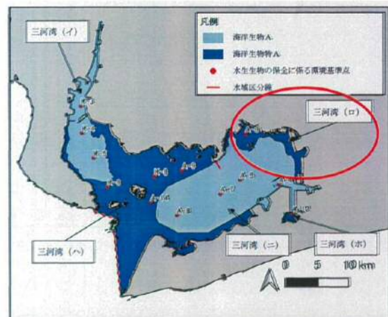
図 三河湾における水生生物保全水質環境基準の類型指定図の概略

三河湾（ホ）の汐川干潟（吉胡 85.7ha、杉山 42.1ha）のようにまとまった水域のため、環境基準点がA12の1地点とは状況が異なる。