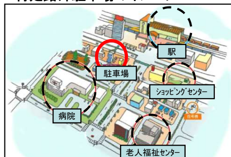
図の○の駐車場のみが特定路外駐車場