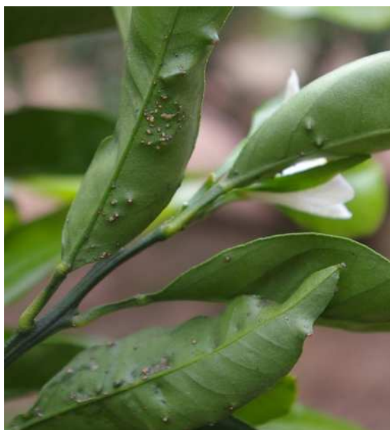
図2 病斑が形成された葉

(3) 窒素肥料が多いと栄養生長が盛んになり、発生が多くなるので、適正な肥培管理に努めましょう。