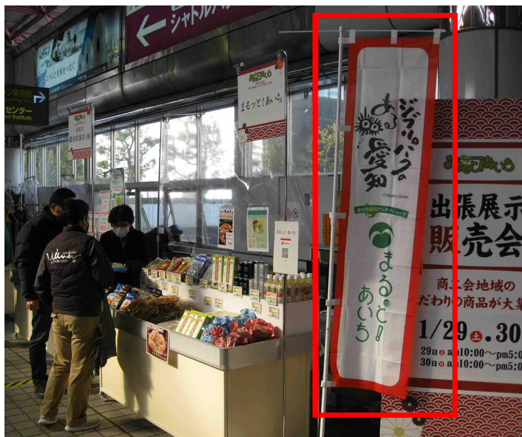
県産品を扱うPRイベントにおいてロゴマークを利用したのぼりを設置