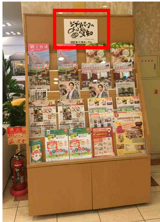
観光案内や地元広報誌等を配架するパンフレットラックにロゴマークの看板を設置