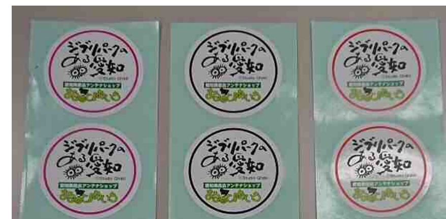
県産品を扱うPRイベントにおいてロゴマークを利用したシールを全商品に貼付け