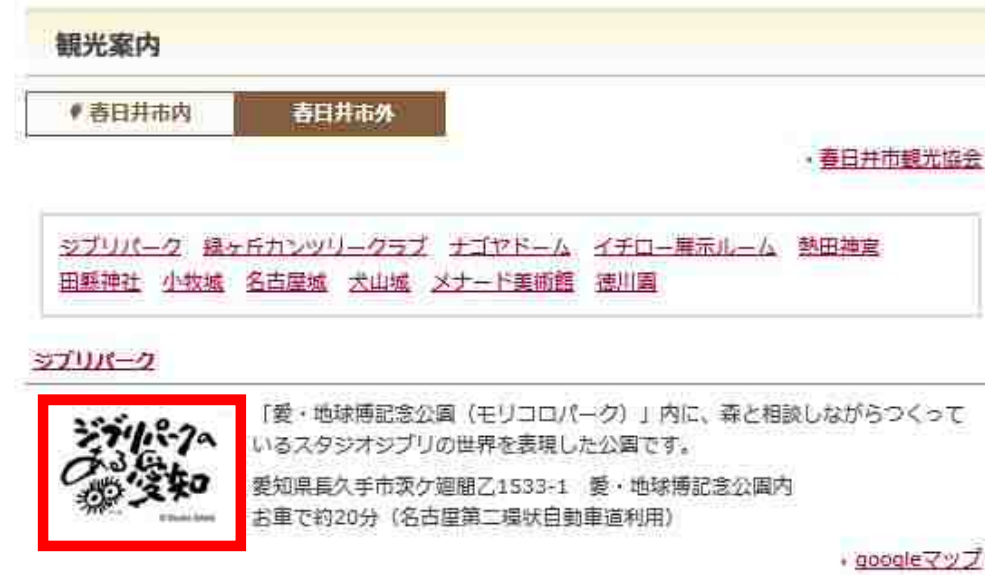
宿泊施設の観光案内HPにおいて、ジブリパークの紹介文とともにロゴマークを掲載