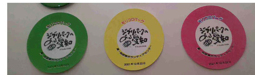
ワークショップにおいてロゴマーク入りの缶バッジを作成