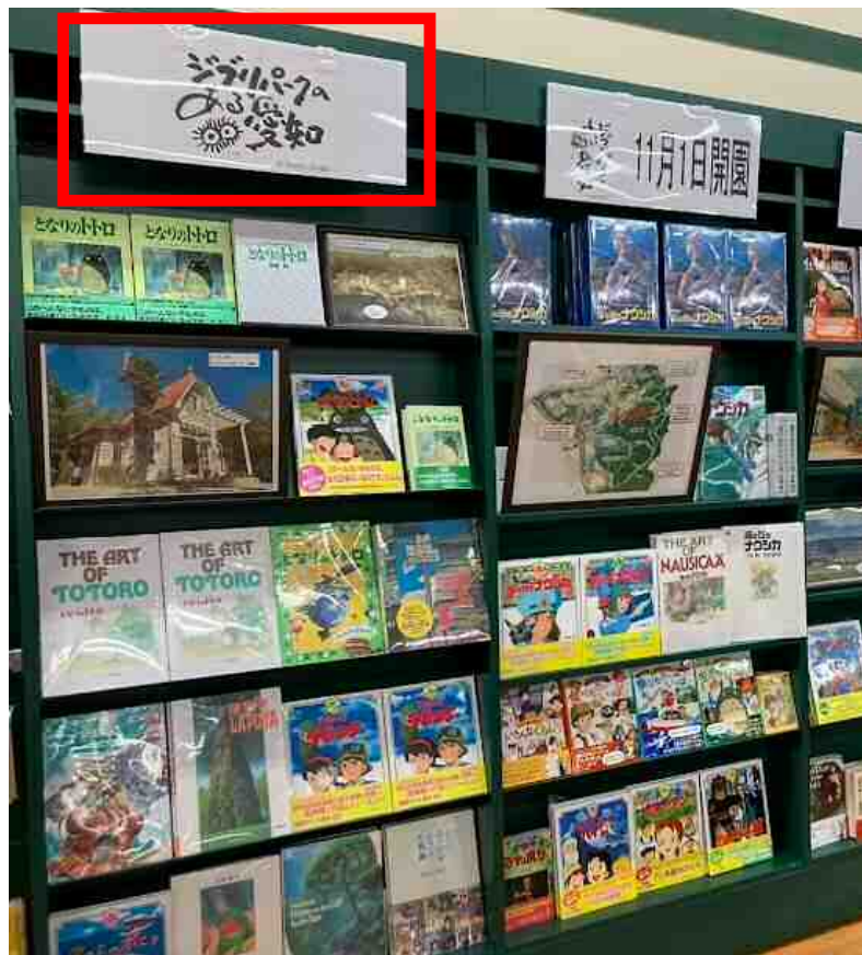
書店のジブリコーナーにロゴマークのパネルを設置