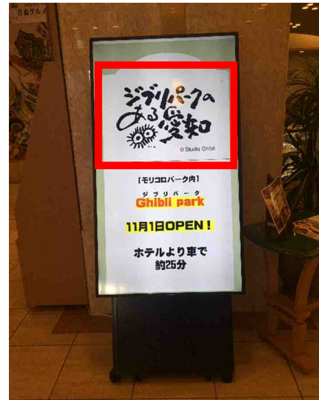
宿泊施設のデジタルサイネージにロゴマークを投影