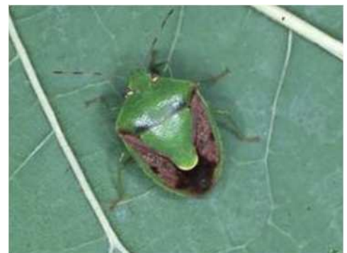
図1 チャバネアオカメムシ成虫

今冬のチャバネアオカメムシの越冬成虫密度は平年並であるものの、越冬成虫の確認地点割合はやや高い状況でした。また、昨年8月から10月までの豊橋市の予察灯におけるチャバネアオカメムシの誘殺総数は過去10年間と比較して最も多く、越冬成虫密度が高まっている可能性があります。これらのことから、 果樹カメムシ類の果樹園への飛来数は6月末までやや多いと予測 します。ほ場での発生状況や5月から始まる果樹カメムシ類の予察灯及びフェロモントラップにおける誘殺数などを参考にして、防除を実施しましょう（表2参照）。