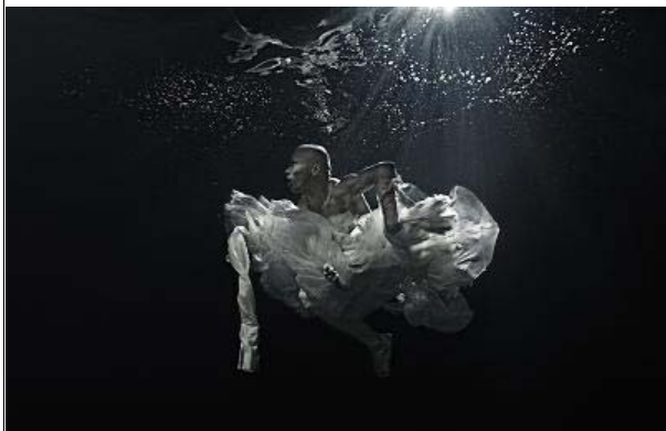
「BREATH & Fata Morgana」(平成23年)