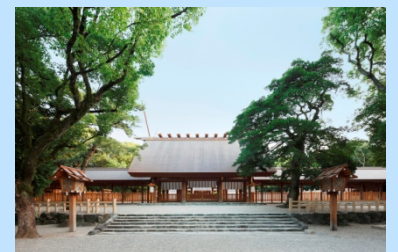
熱田神宮