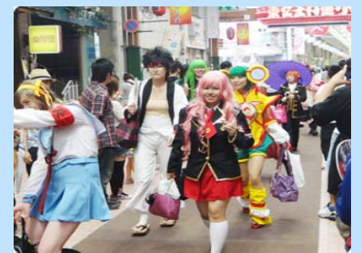
世界コスプレサミット