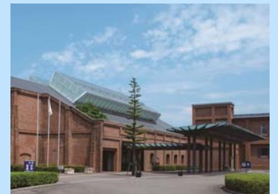
産業技術記念館