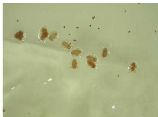
図3 ワセリンに付着した1齢幼虫