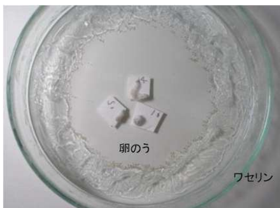
図2 1齢幼虫発生ピークの状況