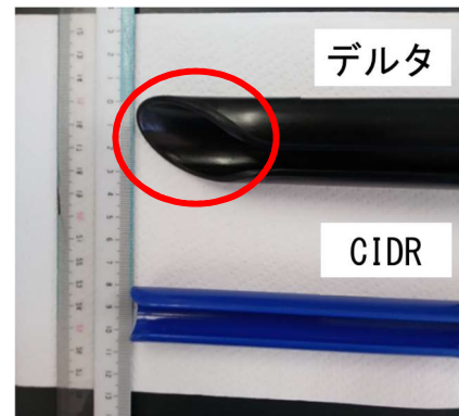
図2 アプリケーター

以上のことから、対象牛や状況において使い分けることで、負担を軽減しつつ、安定的な受精卵生産が望めると考えられた。