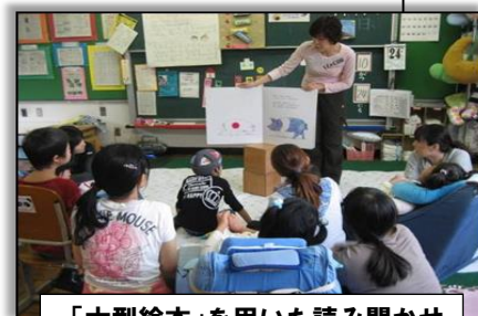
「大型絵本」を用いた読み聞かせ