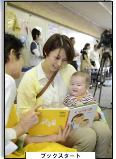
ブックスタート

読書が「好き」な理由としては、「本を読むことが楽しいから」、「想像することが楽しいから」が多くなっています。一方、読書が「嫌い」な理由については、「本を読んでも楽しくないから」や「本を読むことが大変だから」が多く、高校生においては、「本を読む習慣がないから」の割合が圧倒的に高い状況でした。