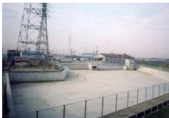
現場打ちコンクリート製貯留施設 (鍛冶ヶ色調整池)