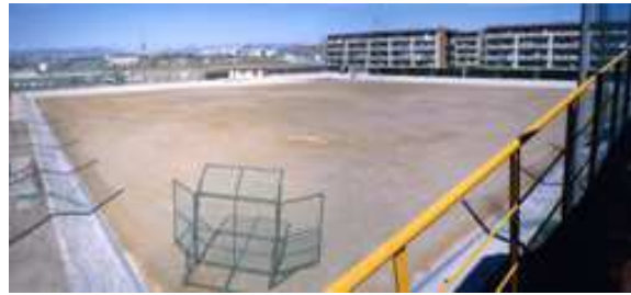
掘下式貯留施設 (親水公園)