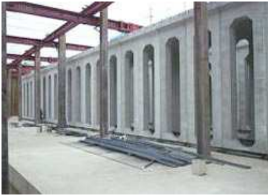
プレキャストコンクリート製地下貯留施設 (能田中央公園)