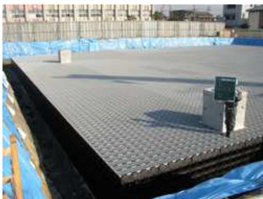
プラスチック製地下貯留施設 (師勝小学校)