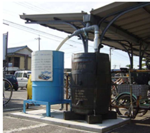
雨水貯留タンクの例

北名古屋市では、住民の皆様にも総合治水対策に関心を持っていただくとともに、少しでも多くの家庭に雨水貯留施設を設置していただき、総合治水対策にご協力していただくことを目的として、奨励金制度を設けています。