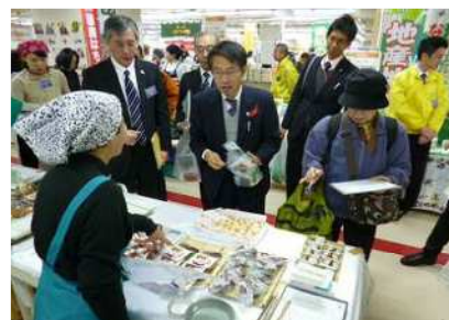
試作商品の消費者意向調査