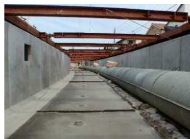
かんがい排水事業中井筋地区 （排水路工事中）

かんがい排水事業により中井筋地区では排水路、村高地区では用水路、特定農業用管水路特別対策事業により金山地区では用水路、水質保全対策事業により吉田1期地区では排水路、農業水利施設保全対策事業により吉良地区では揚水機場の整備を実施しました。