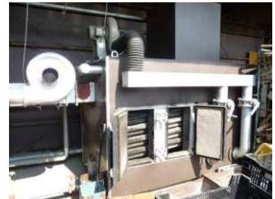
薪ボイラー(温湯式)

木質バイオマス利用加温設備（薪ボイラー）を導入した鉢物生産者においては、その経済性や問題点を調査しました。薪の安定確保や労力の問題があるものの、重油使用量の大幅な削減につながっていることがわかりました。