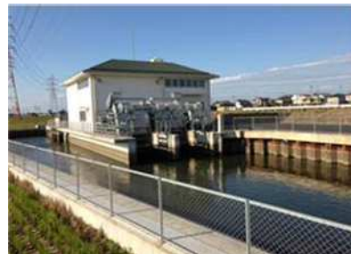
たん水防除事業北浜南部1期地区 (行用排水機場)

緊急海岸整備事業により碧南地区、吉田地区、西尾地区の海岸樋門や堤防の整備を実施しました。