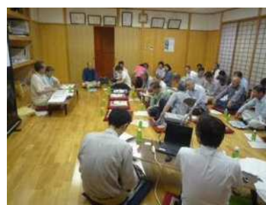
森林整備の地元説明会

また、平成25年11月2日・3日に開催された岡崎市農林業祭において林務課ブースを設置し、森林・林業の普及PRと事業周知を図った。