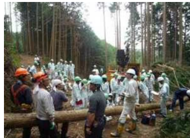
農林高校生の現場体験

林業への新規就労促進のため、農林高校生が林業事業体の作業現場を見学・体験できるよう支援した。