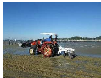
底質改良のための耕うん