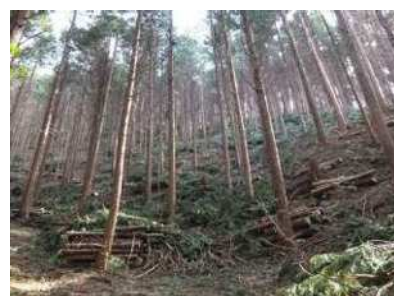
本数調整伐の実施状況

また、保安林の公益的機能の発揮のため、森林の適正な保育(本数調整伐)工事を28ha実施しました。