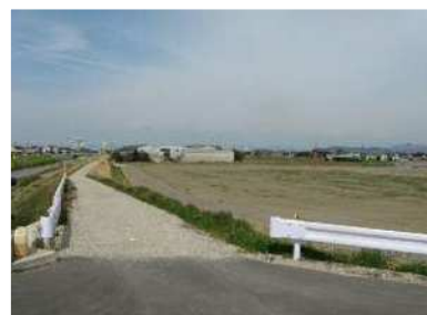
住環境整備事業深池地区 （ほ場整備実施中）

農村活性化住環境整備事業により深池地区では、ほ場整備、排水対策特別事業により深池地区では、排水路、排水機場の整備を実施しました。