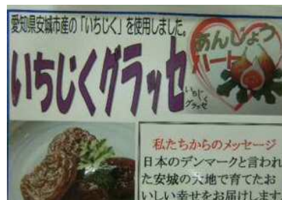
いちじくグラッセ

そして、平成25年11月14日から19日に名古屋市内で開催されたあいち農林水産フェアの会期中の11月15日に商品化した「いちじくグラッセ」を出品して、消費者の意向調査を支援しました。