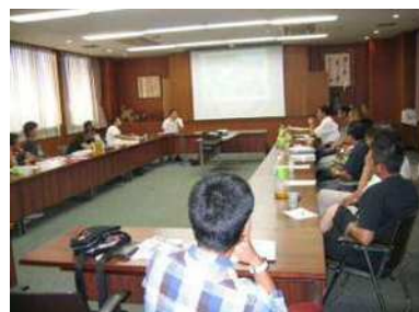
検討会議におけるGAP推進

また、管内511件ある農薬販売所のうち73件について農薬取締法に基づく立入検査を実施し、農薬の適正な販売・使用、保管について指導しました。