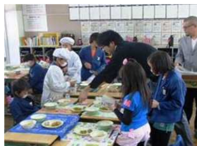
ふれあい学校給食