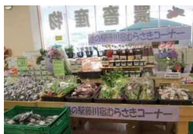
道の駅藤川宿 農畜産物直売所

平成24年12月にオープンした「道の駅藤川宿」産直コーナーで、「むらさきコーナー」を提案し「むらさき色」に関連づけた市内の農産物等の販売を支援しました。また、額田地域のナス・トマト・シネンジョ等の栽培支援を行い、地域資源の販売に結びつけました。