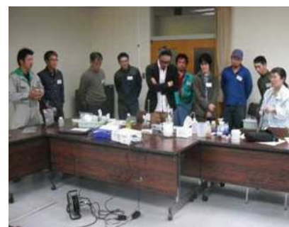
新規就農者向け講習会

新規就農者の定着・支援のため、経営が不安定な就農直後の岡崎市始め7市の新規青年就農者22名に対する青年就農給付金（経営開始型）の給付を支援しました。