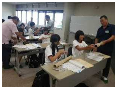
ロープ結び（少年水産教室）

三河地区漁業地域の中学生を対象に平成25年8月2日に開催された「少年水産教室」の参加者募集と同教室運営に積極的に協力しました