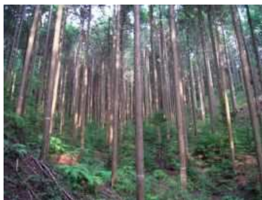
間伐後の森林(額田町)