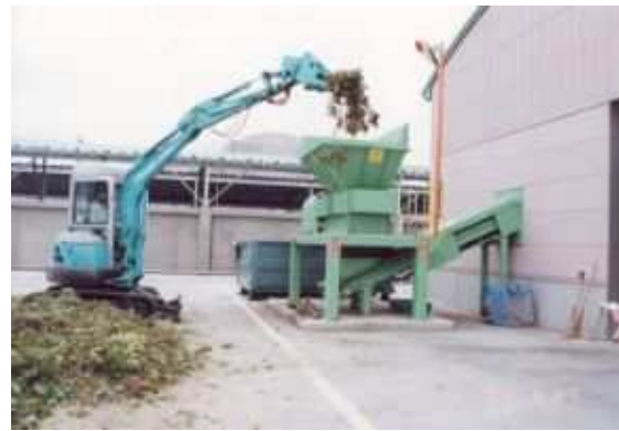
リサイクルプラント事業（安城市）