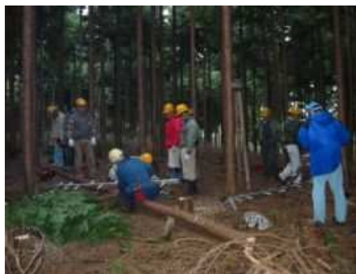
森林ボランティア（額田町）