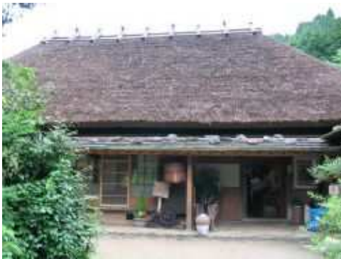
茅葺き屋敷「ぬかたいなか村」(額田町)

生活環境の整備については、農業集落排水、集落道、水辺環境等の整備を通じて若者にも魅力的で快適な地域づくりを推進しています。