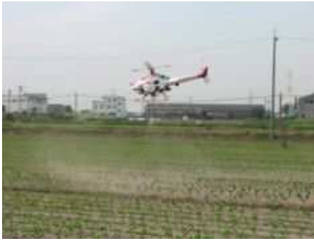
無人ヘリコプターによる病虫害防除