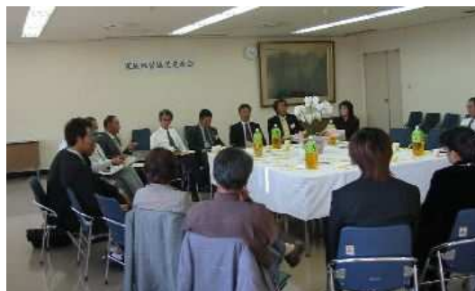
家族経営協定締結農家による情報交換会