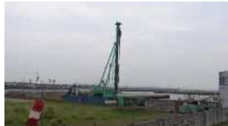
建設の始まった一色漁港内の水産物荷捌施設