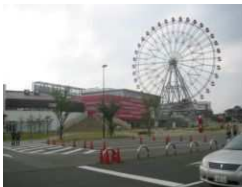
刈谷ハイウェイオアシス