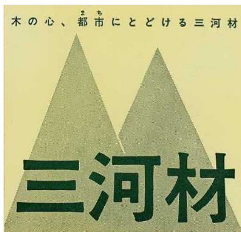
三河材（額田産）認定シール