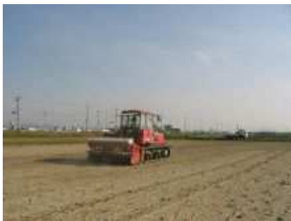
大規模営農状況（安城市）

生産の基礎となる農地・林道などの生産基盤を始め、高性能な機械、施設等の整備を進め、生産性の向上を図るとともに、水産資源の回復などを引き続き実施していく必要があります。