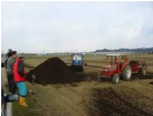
水田作への堆肥利用（吉良町）

また安城市では、果樹や街路樹から発生するせん定枝を堆肥化し、土づくりの資材として利用するリサイクルプラント事業も取り組まれています。