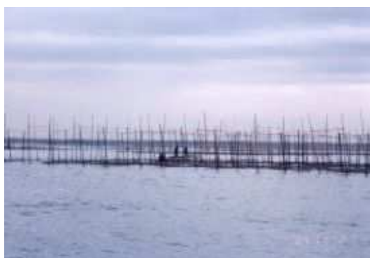
三河湾ののり養殖

農村地域からの家庭雑排水の対応として、農業集落排水事業により平成 16 年度末までに 44 地区(汚水処理人口 53,020 人)で整備が進められています。