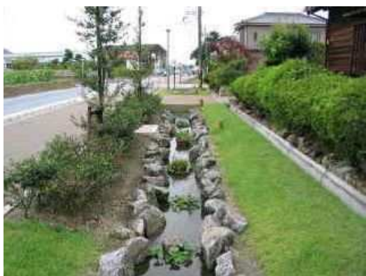
農村自然環境整備事業 花の木地区(安城市)

また、農業水利施設の有する水辺空間を活用した豊かで潤いのある生活環境の整備(平成 16 年度 3 か所)や、農村地域の自然生態系の保全・回復(平成 16 年度 1 か所)も推進しています。