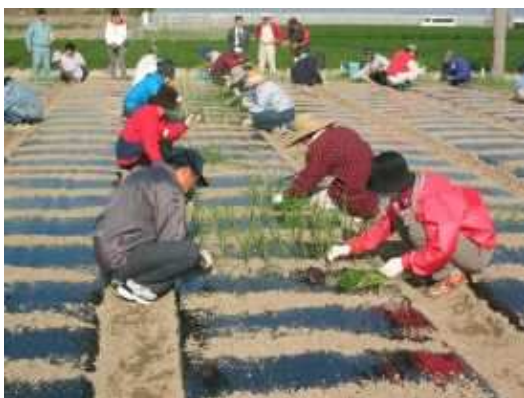
農業応援ボランティア（碧南市）

地域の農林水産業を維持していくためには、中心となる担い手の育成確保が必要であることはいまでもありませんが、担い手はその力を十分に発揮できるよう、地域の特徴を活かした支援組織の育成強化も重要な課題となっています。