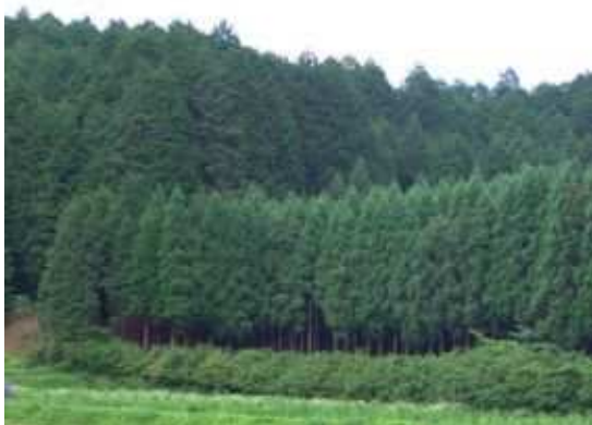
美しい人工林 (額田町)

中山間地域における農地の適正な利用推進、耕作放棄等の防止等を図るため、平成 12 年度から中山間地域等直接支払制度を推進しています。(平成 16 年度対象面積 80 ha)