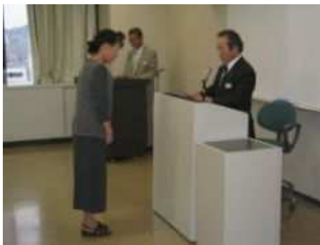
食品表示ウォッチャー依頼式（17年度）

食の安全の確保は、県民の食生活にとって最も基本的な課題です。農林水産物の生産・流通課程の安全性に不安を抱くことのない、健全な食生活の実現に向けた一層の取り組みが求められています。