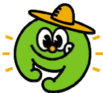
いいともあいち運動のシンボルマーク

当地域は、都市化が進むなかでも県内有数の農業地帯であり、都市と農山漁村との交流を深める取り組みを促進し、多くの県民が農林水産業に関わることにより、森林、農地、海及び川が適正に保全・利用され、その多面的な機能が十分発揮・活用されることが大切です。