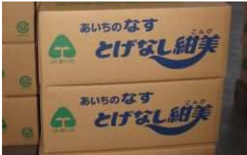
促成なす新品種「とげなし紺美」