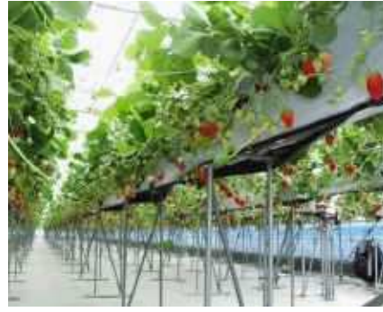
いちごの高設栽培