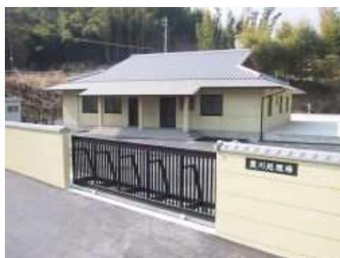
霞川処理場(岡崎市)