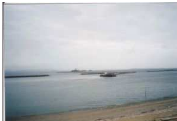
水質浄化機能に優れ、多様な水生生物の宝庫 干潟(幡豆郡吉田地先)