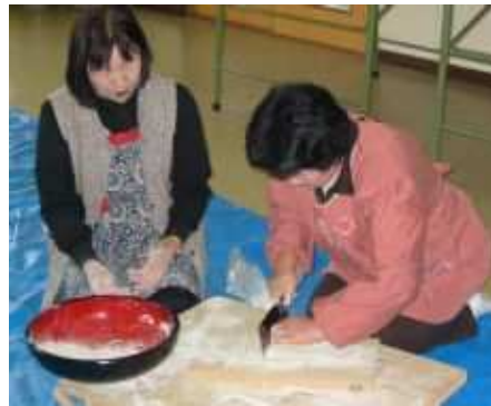
農山漁村女性と消費者とのふれあい体験交流