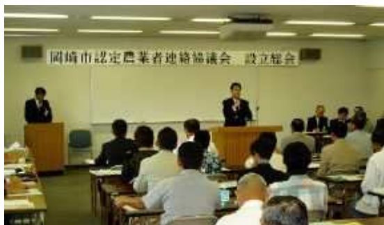
認定農業者連絡協議会設立総会（岡崎市）

家族経営協定については、より魅力ある農業経営の実現に向けて 96 戸の農家が協定を締結していますが、まだ、一部の農家にとどまっており、その推進が課題となっています。