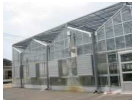
ばら育苗栽培施設（西尾市）