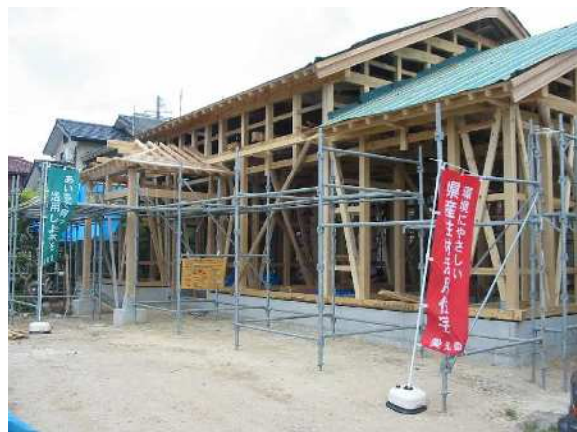
認証材を使用した家づくり（岡崎市内）