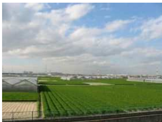
整備された農地 (碧南市)