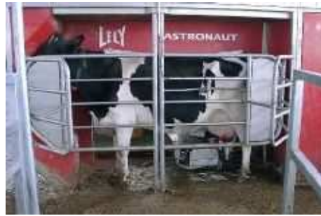
搾乳ロボット（西尾市）