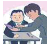
意思を伝え合うために絵や写真のカードやタブレット端末などを使う