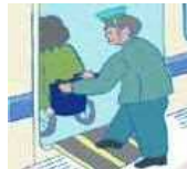
段差がある場合に、スロープなどで補助する

(※障害者差別解消法(改正法施行前)では、行政機関等は義務、事業者は努力義務とされている。)