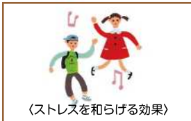
〈ストレスを和らげる効果〉