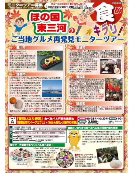
「ご当地グルメ再発見モニターツアー」PR用チラシ