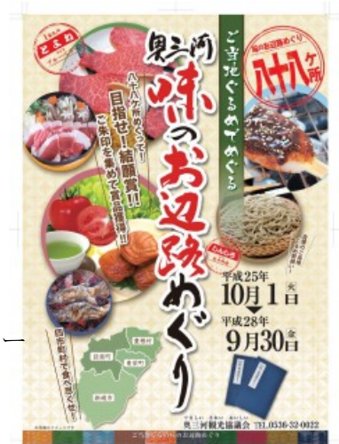
「奥三河 味のお辺路めぐり」PR用ポスター