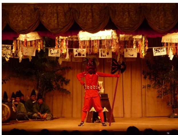
花祭シンポジウム（名古屋市博物館：11月2日）