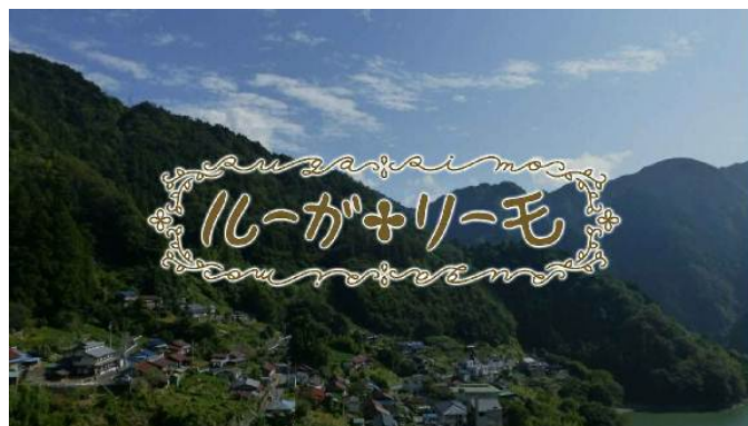
インターネット動画「ルーガ・リーモ通信」