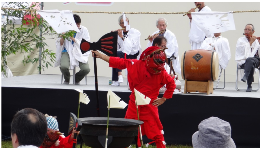
「きてみん！奥三河」下黒川花祭（茶臼山高原：9月14日）