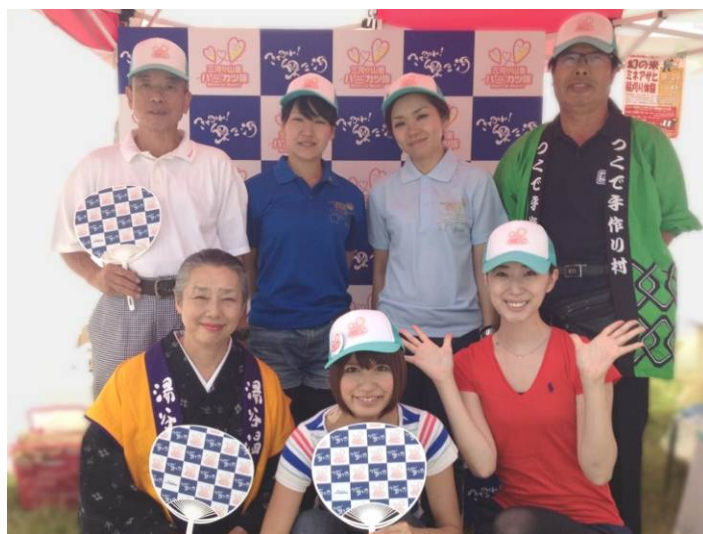
三河の山里ハーカツ隊