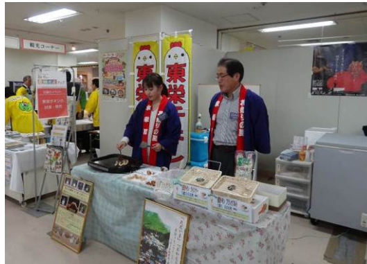
「あいちの農林水産フェア」（丸栄）