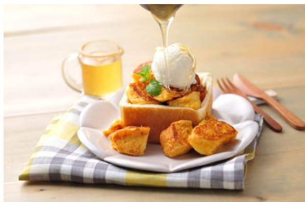
6種類のおやまのアイス