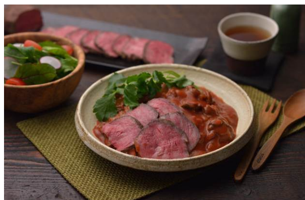
段戸牛ローストビーフのハヤシライス

今後も愛知県では、三河山間地域の特産品等の認知度の向上、高付加価値化及び消費拡大を図るとともに、都市と農山村との交流の促進を図ってまいります。