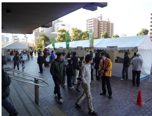
特選品PRイベント(11月23日～24日)