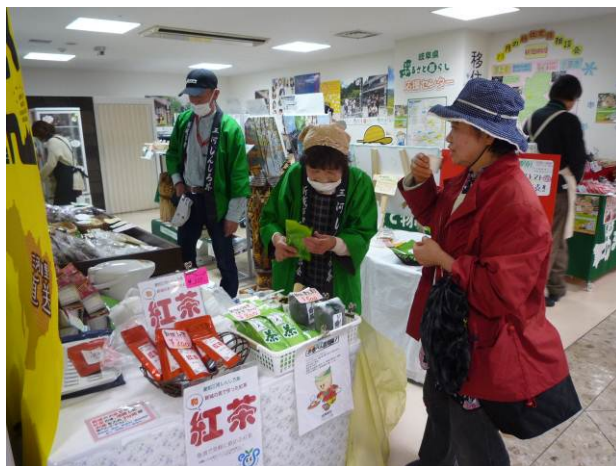
「どだくさん」での紅茶(新城市)の試飲の様子