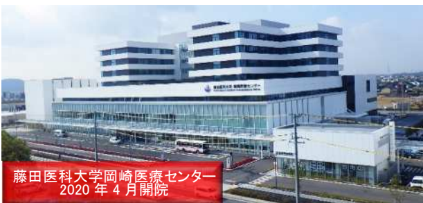
藤田医科大学岡崎医療センター 2020年4月開院

都市機能誘導区域(岡崎駅南地区)内において、2020年4月に藤田医科大学岡崎医療センター、2020年10月に複合商業施設が立地。新たな都市機能誘導施設(岡崎警察署等)の立地も予定。