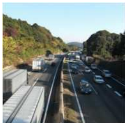
▲ 東名高速道路 (日交通量約 107 千台)