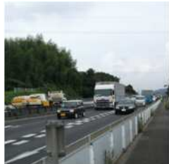
▲ 国道1号 (日交通量約 24 千台)