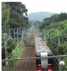
▲ 名鉄名古屋本線 (日輸送量約 51 千人)