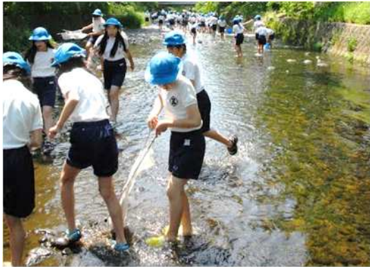
水生生物調査の様子