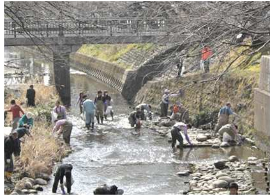
クリーンアップ五条川の様子