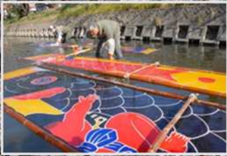
のんびり洗い (岩倉市・五条川)