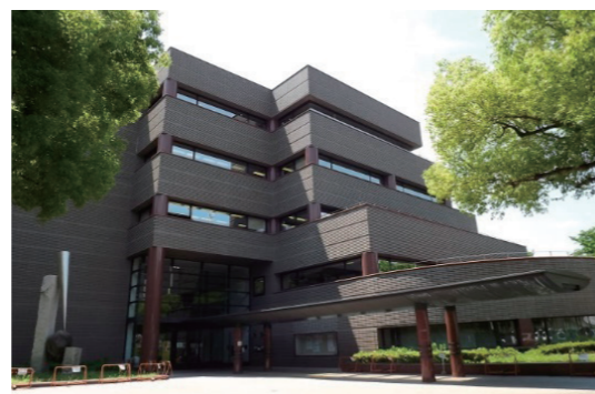
愛知芸術文化センター(名城施設) 県図書館