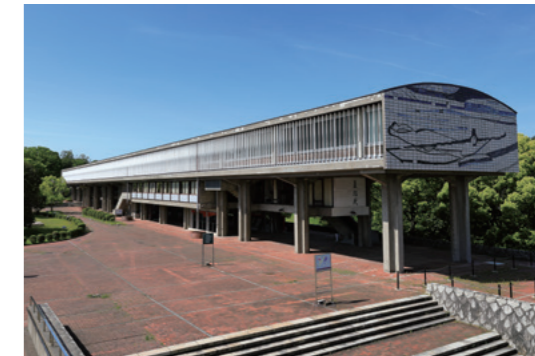
愛知県立芸術大学 講義棟