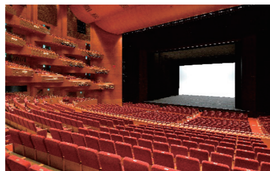
県芸術劇場 大ホール