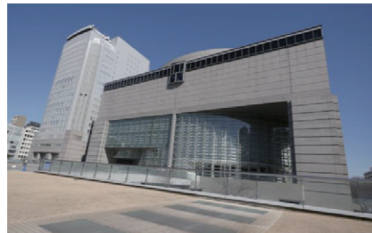
愛知芸術文化センター(栄施設)