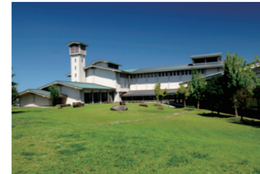
愛知県陶磁美術館