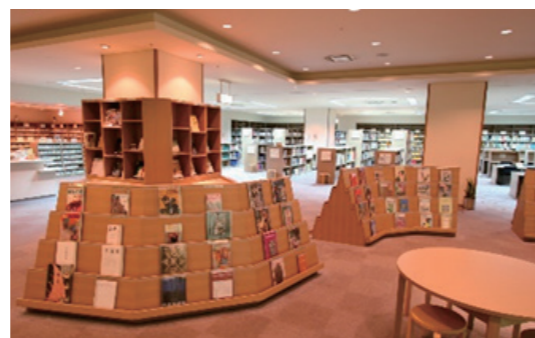
県文化情報センター アートライブラリー