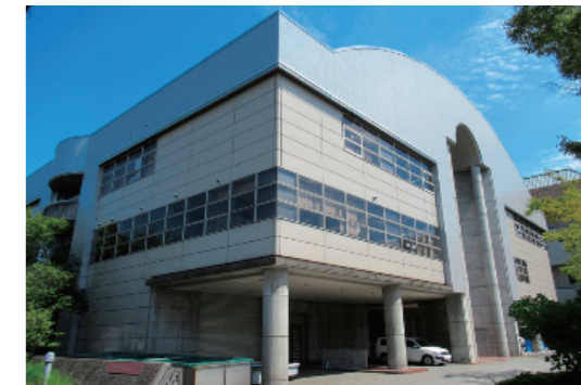
愛知県埋蔵文化財調査センター