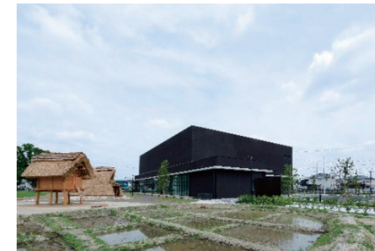
あいち朝日遺跡ミュージアム