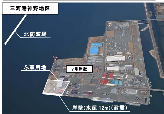
完成自動車の増加や船舶の大型化に対応するとともに、大規模地震時には、緊急物資の受入拠点としての役割を担う、水深12mの耐震強化岸壁を整備