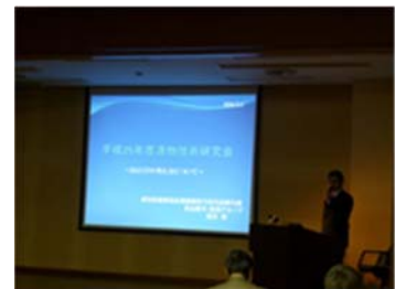
〈取組項目：安全に関する自主管理と情報開示の促進〉