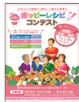
〈取組項目：地域における健康づくりの推進〉