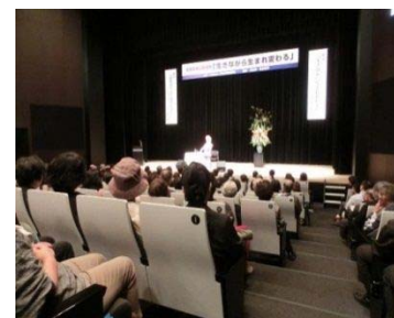
〈取組項目：食品と医薬品との相互作用に対する普及啓発〉