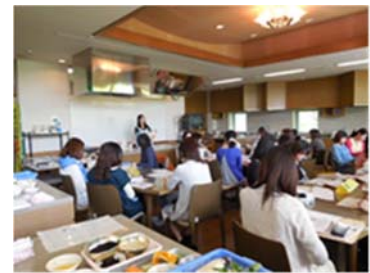
〈取組項目：「妊産婦のための食生活指針」の推進〉

教室に参加された方は、「こんなに普段ご飯は食べてない」「野菜がいっぱい」などの声があがっており、実際に食べることで普段の食生活の見直しができているようです。今後は、妊娠前の若い世代から食の正しい知識をもち、健康な子どもを生み育てられる体づくりの大切さを啓発する必要があると感じています。