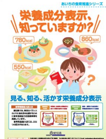
〈取組項目：職場での健康診断等に基づく食生活改善の推進〉

■好事例：野菜バイキングコーナーの設置 味噌汁と減塩味噌汁の2種類の提供 健診データからの栄養目標量の算出