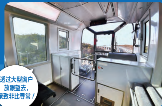
透过大型窗户 放眼望去, 景致非同寻常!

Linimo使用自动列车运行装置(ATO)实现无人自动驾驶。由于没有驾驶员,如果坐在最前排,可以透过正前方整面的玻璃窗欣赏前进方向的景色。安静地行驶,无需隔音板,窗玻璃更大,因此车内明亮,给人开阔感。高架车站居多,可以欣赏到令人赞叹的景致。