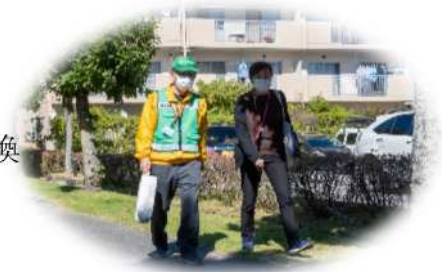
歩きながらの情報交換