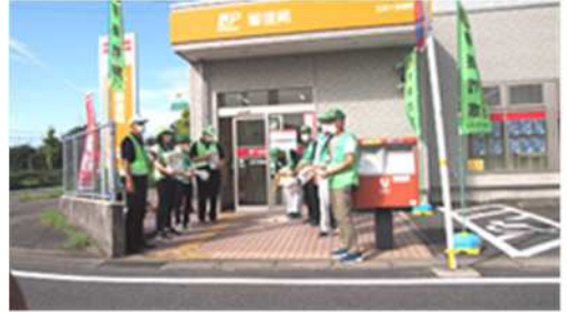
三好ヶ丘郵便局前 啓発活動