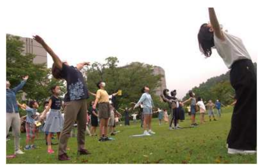
三好丘公園での夏休みラジオ体操