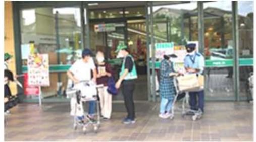
メグリア三好ヶ丘店前での啓発活動