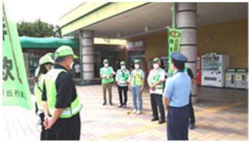
豊田警察署担当員の訓示