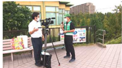
ひまわり TV 局からの取材