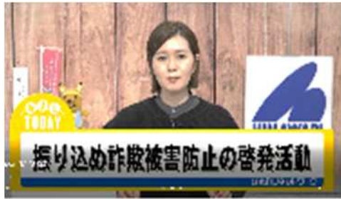
ひまわり TV [みよし TODAY] で放映