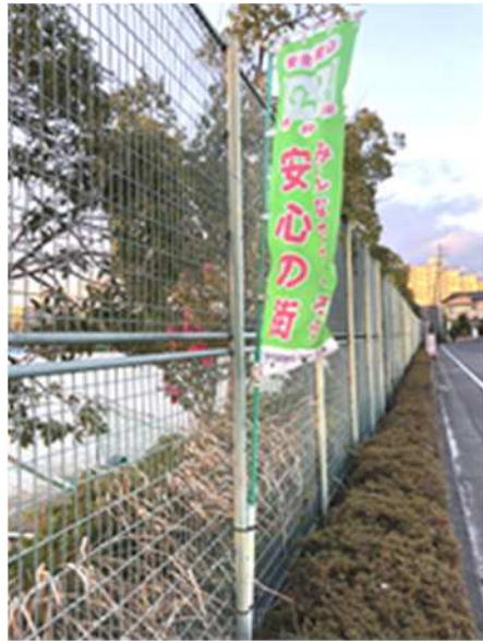
安心の街づくり」のぼり旗