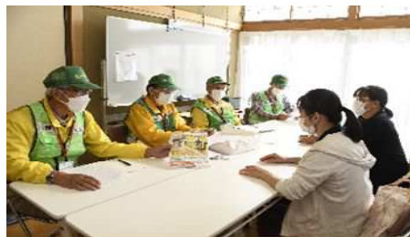
出発直前の打合せ