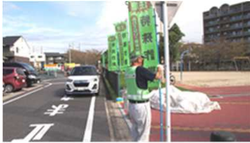
「特殊詐欺に注意」のぼり旗設置