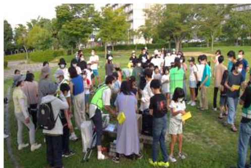
最終日に啓発活動実施