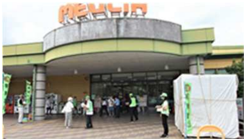
メグリア三好店正面入り口