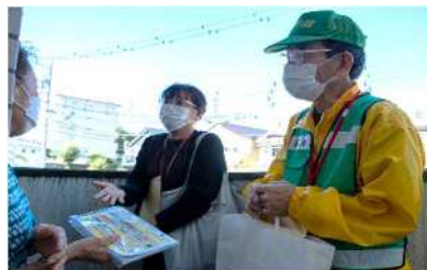
玄関先での啓発活動①