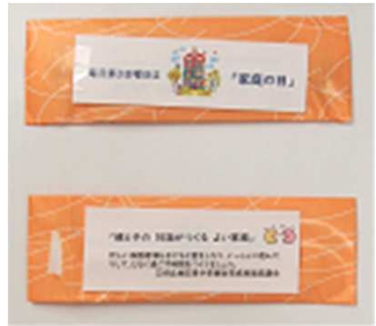
「家庭の日」啓発チラシ