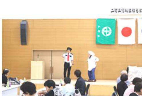
「笑劇波」による啓発演劇の上演