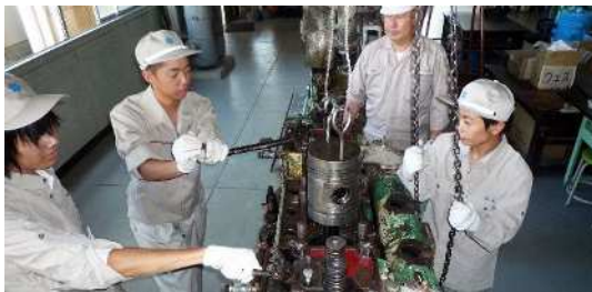
<大型エンジン取扱実習の様子>

船舶を中心にさまざまな機械の仕組みや各種エンジンの運転・保守に関する技術・知識を習得するとともに、エンジンや機械などの設計・製図実習、大型実習船による船舶機関運用実習のほか、モーターボートや、水上バイクの操船実習なども行います。地場産業の自動車関連企業とマリンエンジニアの両面に通用する、汎用性に富むエンジニアの育成を目指しています。