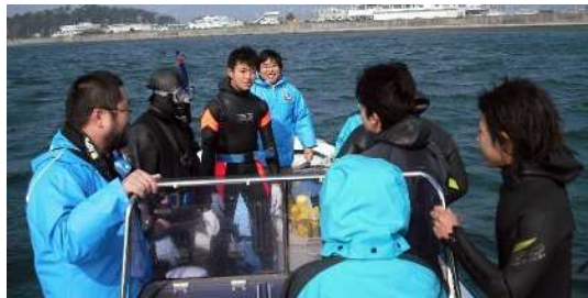
<海洋環境調査実習の様子>

海洋環境コースでは、魚類や底生生物、プランクトンなどの生理・生態、分類・同定に関する知識・技術を習得するとともに、環境測定機器による水質・底質などの環境調査やスクーバダイビングによる海洋生物の生態調査実習を行います。海に関わる実習に必要なライセンスとして、小型船舶操縦士、潜水士やダイビングCカードなどを習得し、3年生では、小笠原でのダイビング実習を行います。