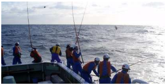
<カツオー一本釣り実習の様子>

マリンレジャーを含む船舶の操縦や運航に関する知識・技術を習得するとともに魚を獲るためのさまざまな方法を学びます。大型実習船愛知丸によるカツオー一本釣り漁業実習や沿岸航海を行い、外地入港（済州島を予定）等で国際的視野を広める経験もできます。また、一級小型船舶操縦士を養成するための操船実習やカサゴ等の船釣りやキス網等の沿岸漁業実習も行っています。