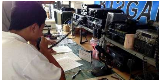
<アマチュア無線交信の様子>

情報通信科には、全国でもトップクラスの専攻科が設置されています。本科では、無線通信や電気電子・情報処理など幅広い分野の基礎的な知識・技術を学び、他の学科と比較しても多くの資格を取得できることが特徴です。近年は多くの生徒が専攻科への進学を希望しており、専攻科で最上級の国家資格を取得することで、専門技術者として活躍することが期待されます。