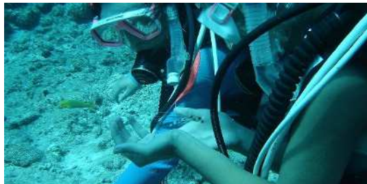
<スクーバダイビング実習の様子>

栽培漁業コースでは、魚類や海藻類などの生理・生態、種苗生産・増養殖技術や、初期餌料の培養に関する知識・技術について学びます。また、海に関わる実習に必要なライセンスとして、小型船舶操縦士やダイビングCカードなどを習得し、3年生で、奄美大島でのクロマグロ養殖場見学やダイビング実習などを行います。