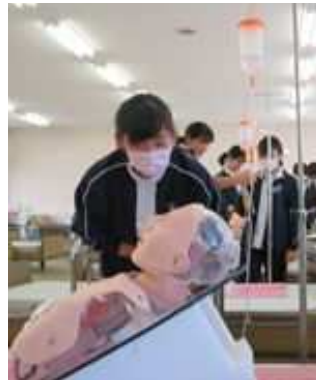
<医療的ケアの実習>

「社会福祉基礎」 「介護福祉基礎」 「コミュニケーション技術」 「生活支援技術」 「介護過程」 「介護総合実習」 「介護実習」 「こころとからだの理解」