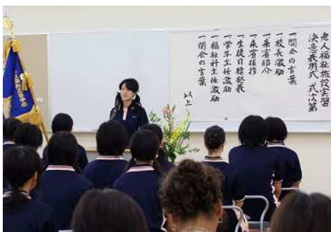
<施設実習決意表明式>