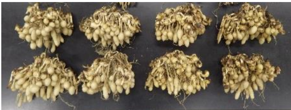
図5 短日期の窒素施用濃度の違いによる地下部様子(左から0、15、30、60 ppm)