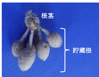
図1 クルクマ球根(アイルージュ)

球根植物であるクルクマは、通常2~3月に無加温施設に球根を定植し、5月下旬~10月上旬まで採花し、株の地上部が黄化枯死した12月以降に新球を掘り上げ、次作に用いている。球根は、根茎に貯蔵根が着生した形態をしており(図1)、重いものほど開花が早く、総開花数も多くなる 3) 。このため、切り花・鉢花いずれの栽培であっても根茎と貯蔵根を合わせた球根重量が重いものが求められる。そのため球根重量を重くするための管理方法を確立することはクルクマの産地振興に非常に重要な課題となる。