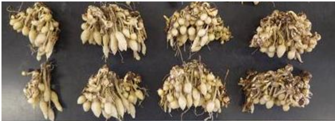
図4 長日期の窒素施用濃度の違いによる地下部様子(左から0、15、30、60 ppm)