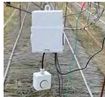
モニタリング本体(『はかる蔵』)