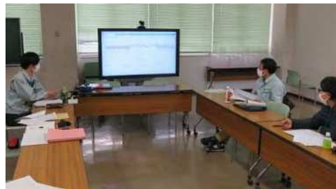
第5回検討会議の様子