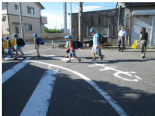
A方向からの通学団の横断風景