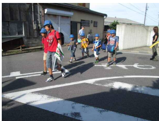
A方向からの通学団の横断風景