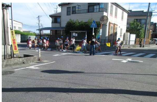
B方向からの通学団の横断風景