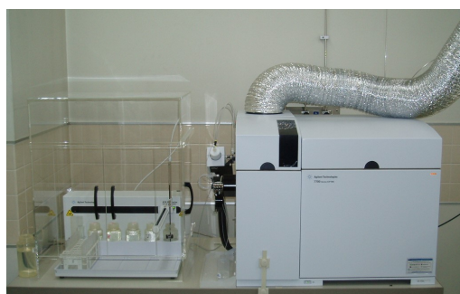
誘導結合プラズマ質量分析計 (金属類の測定)