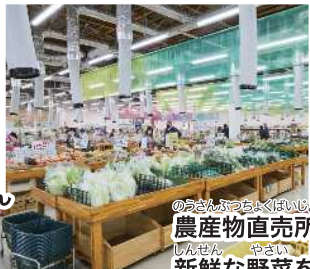
のんぽふちよくほいし 農産物直売所で 新鮮な野菜を!!