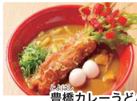
豊橋カレーうどん

愛知県最大級の道の駅です。特産品をお土産に買ったり、豊橋カレーうどんなどの地域の食事を楽しめます。