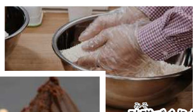
味噌づくりが 体験できる!!