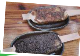
ごへいもち 五平餅

朝採れ野菜の買物や、五平餅、鮎の塩焼などの地域の 食文化を楽しめます。春は美しい桜並木も楽しめます。