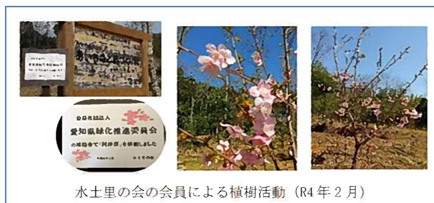
水土里の会の会員による植樹活動 (R4 年 2 月)

今後も週 3 回の定期的 (暑季、年末年始を除く) な活動を維持していくとともに、若い世代の住民が里山整備活動に取り組めるよう、指導する機会を設けながら後継者を育成している。