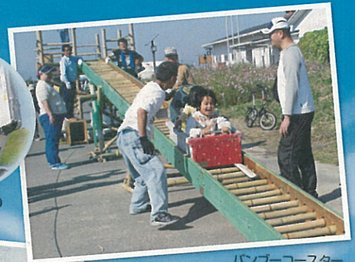
バンブーコースター