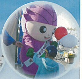
大治町のはるちゃん