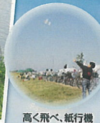
高く飛ばせ、紙飛行機