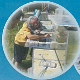
お魚観察 (ガサガサ探検)

庄内川・土岐川流域の文化・物産の交流と コミュニケーションの場として、 盛りだくさんの内容で開催します。 皆さまのご来場をお待ちしております。