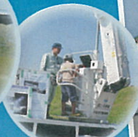
災害対策車の 展示