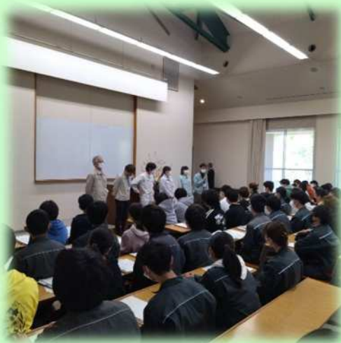
式の後、学生会や職員紹介を行いました