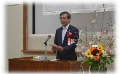
知事祝辞 鈴木農業水産局長