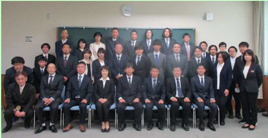
受講生と関係職員