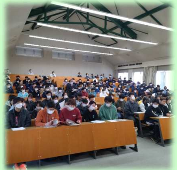
大講堂での始業式（1・2年生）