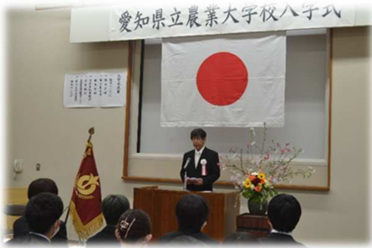
厳粛な雰囲気で行われた入学式