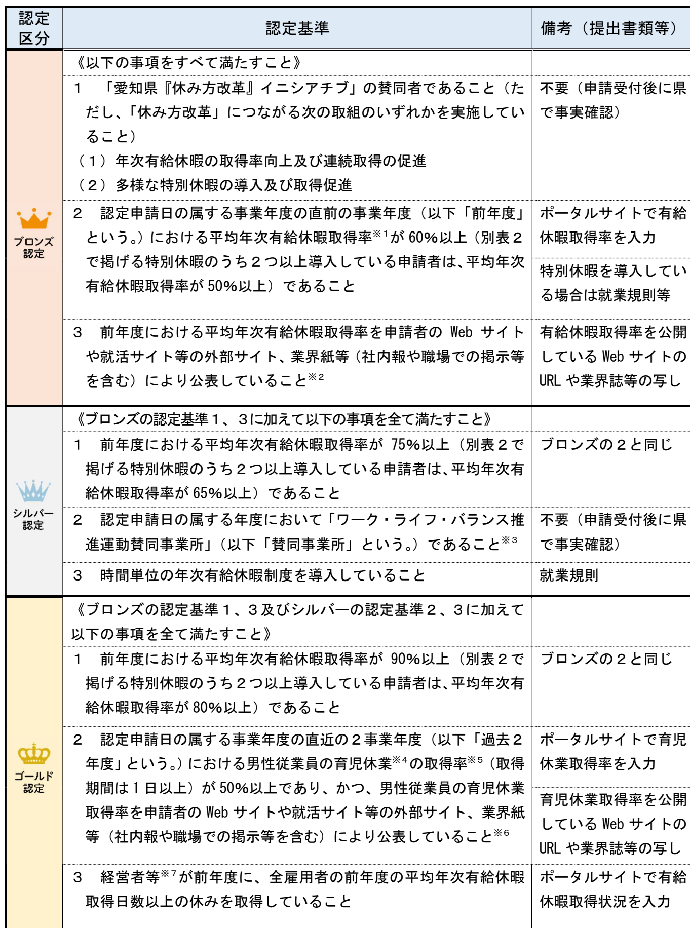
別表1 認定基準及び提出書類等