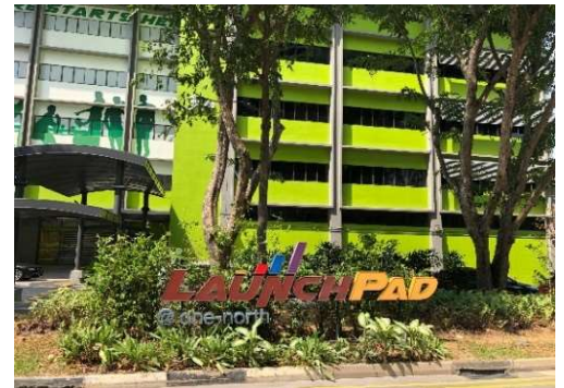
ブロックセブンティワン BLOCK 71

シンガポール国立大学は、スタートアップ支援を目的とする機関として、2002年にNUS Enterpriseを設立。NUS Enterpriseは、NUSの学生が、海外の企業でインターンシップを経験する、「NUS Overseas College Programme」の実施や、インキュベーション施設である「BLOCK71」を運営しており、世界で活躍する学生や起業家を4,000人以上育成している。