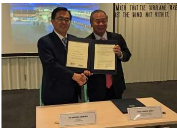
スタートアップ支援に関する覚書を締結 (2019年9月)