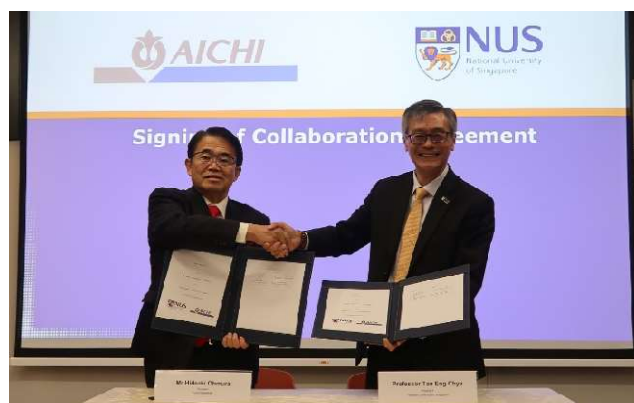
BLOCK71 Nagoya 開設に伴う合意書に署名 (2022年8月)