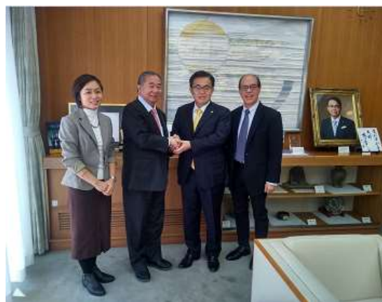
シンガポール国立大学ボウイ副総長 知事表敬訪問 (2019年12月)